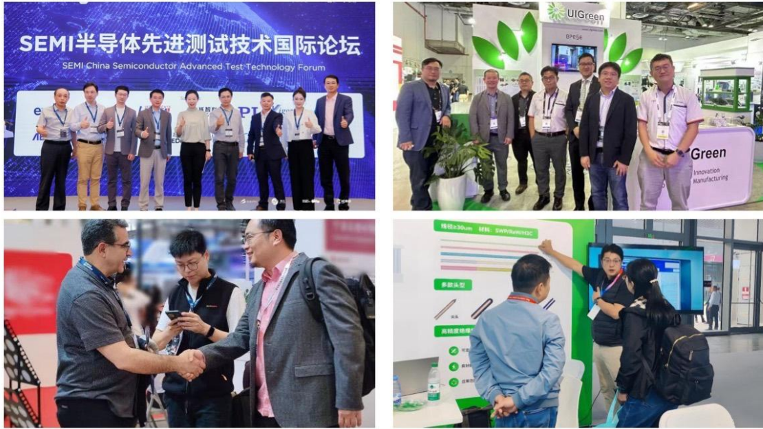
图：参加各类展会及研讨会

2025年，公司在产品宣传、完善渠道、产品服务、销售队伍建设等方面多措并举，积极参与国内外展览会，加大市场宣传力度。公司协多款明星产品及核心技术亮相 SEMICON China 2025、新加坡 SEMICON SEA、中国国际光电博览会（CIOE）、2025 SEMI 大湾区产业峰会、2025 成都 ICCAD-Expo 等展会与论坛，通过与客户面对面学习探讨，开展互利合作。此外，公司还逐步建立健全日本、瑞士、美国等海外销售及服务点，新设中国香港、新加坡公司，抓住海外市场复苏的机会，努力提高海外销售占比。