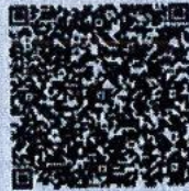
周蓓蓓年检二维码

本证书经检验合格,继续有效一年。 This certificate is valid for another year after this renewal.