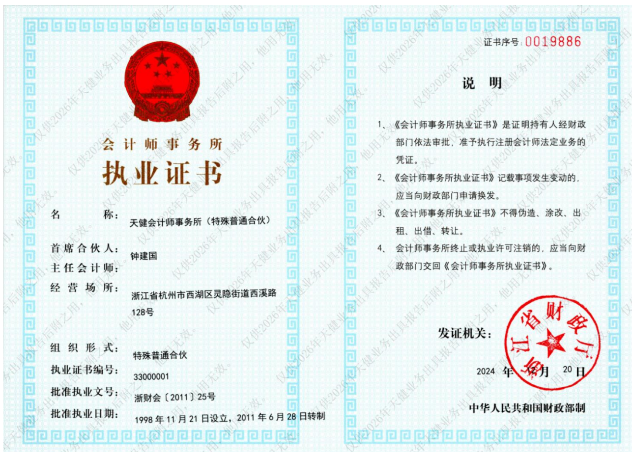
附件二 本所执业证书复印件

本复印件仅供杭州当虹科技股份有限公司天健审(2026)8419号报告后附之用, 证明天健会计师事务所(特殊普通合伙)具有合法执业资质, 他用无效且不得擅自外传。