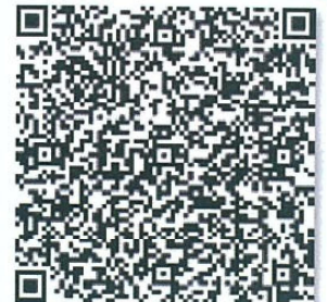
赵金的年检二维码.png