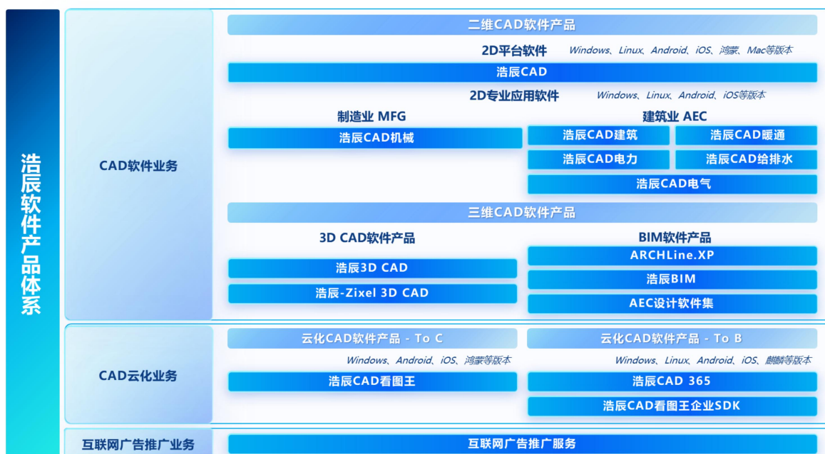
图：浩辰软件主要业务及产品体系