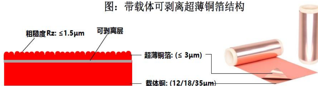
图：带载体可剥离超薄铜箔结构

当前，国内外高端芯片龙头企业对带载体可剥离超薄铜箔存在较大需求，以实现先进制程芯片与基板的精密互连。然而，带载体可剥离超薄铜箔全球市场被日本三井铜箔垄断，卡脖子问题严重，对与我国高端芯片封装领域密切相关的 5G 通讯、人工智能、大数据中心、汽车电子等关键行业造成较大制约，实现带载体可剥离超薄铜箔的供应链本土化需求较为迫切。