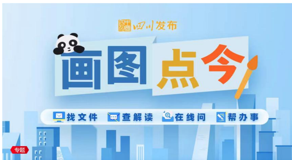
《画图点今》专题截图

四川发布继续推进“画图点今”政策解读原创专栏，推出共 23 期“画图点今”。其中，围绕省政府文件《关于进一步推动经济运行回升向好的若干政策措施》，四川发布客户端通过图文、图解等不同方式多维度做好相关解读工作，帮助网友更准确更直观地了解政策要点。