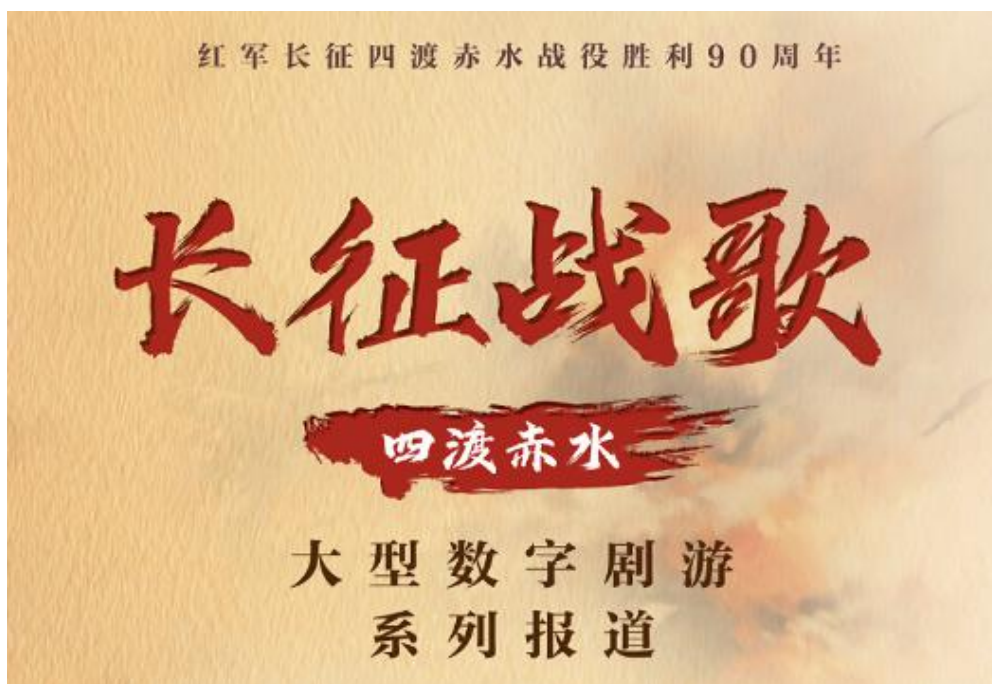
《长征战歌》产品截图

策划推出大型数字剧游《长征战歌》系列报道，通过“沉浸式数字短剧+互动游戏”融合报道形式，聚焦长征在四川的关键事件，细细铺陈四渡赤水的智勇交锋、彝海结盟的深情厚谊、飞夺泸定桥的生死时速、翻雪山过草地的坚韧不拔，展现四川在红军长征中的特殊地位和突出贡献，以及长征路上四川的辉煌巨变。