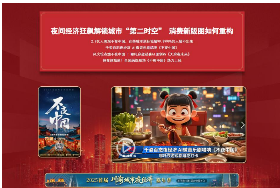
《不夜中国》产品截图

聚焦“十四五”成就，推出手绘长卷《天府八骏图》，展示了四川综合实力和核心竞争力显著增强，区域城乡发展更加协调，改革开放取得新的突破，绿色低碳转型步伐加快，人民生活品质稳步提高，安全稳定基础更加坚实，绘就了一幅色彩斑斓的四川画卷。