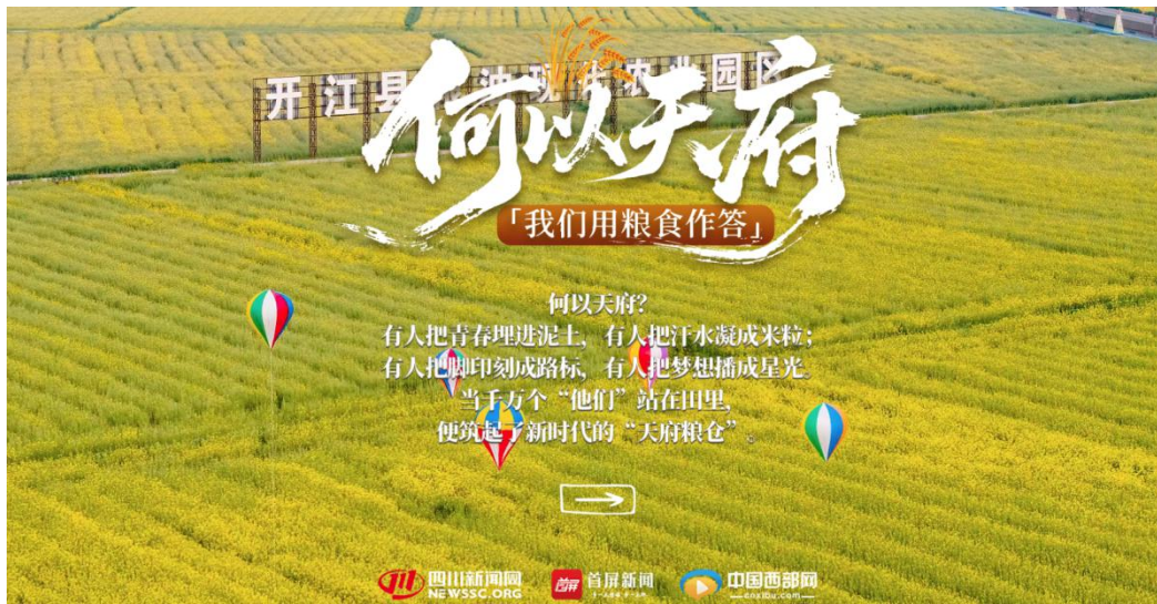
《何以天府，我们用粮食作答》特别策划截图

联动凉山、成都、眉山、绵阳等市州学习平台深入村落，聚焦总书记关注的悬崖村、三河村、火普村、战旗村、永丰村、石椅村，推出主题报道《春风吹进咱们村》，曾经贫瘠偏远的它们，如今因春风拂动焕发新颜，科技助力振兴，医疗保障生活，文旅融合让乡村文化多彩。