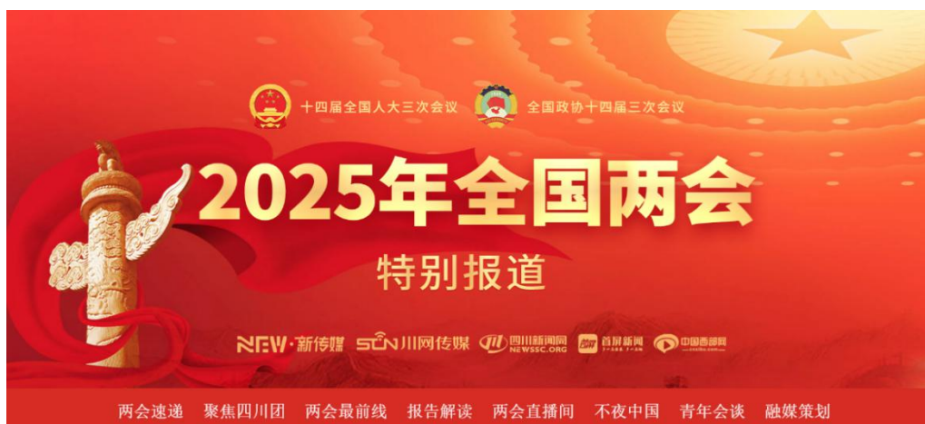
《2025年全国两会特别报道》专题截图

在2025年全国两会宣传报道中，开设“天府夜未央”“千年CP，我AI了”“两会最前线”“代表委员说”“春语春愿”“掌上看两会”“一线民生”“四川开麦”等专题专栏。其中《千姿百态夜经济 AI微音乐剧唱响〈不夜中国〉》报道获中央网信办全网推送，《不夜中国》专题被学习强国总平台推送，AI原创MV《天府夜未央》等11个产品被天府融媒体联合体推送，充分发挥了舆论引导主力军主渠道主阵地作用，营造了昂扬向上的浓厚氛围。