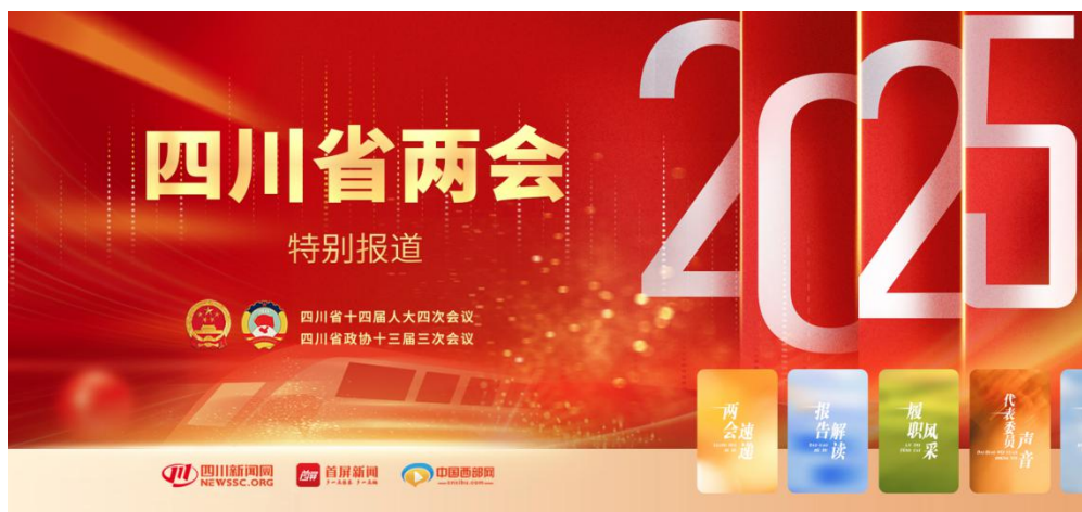
《2025年省两会特别报道》专题截图

题专栏，生产了一批如《9张微距AI镜像 点亮2025“四川新愿景”》《“满天”都是无人机》《2025，AI上非同一般的四川》《主角你好！请查收蜀于你的2024人生剧本》《一起来开会，聊聊我们关心的那些事儿》《川菜快问快答：各国领事官员都喜欢吃什么川菜？》等传播量与影响力兼具的精品力作，为大会胜利召开营造浓厚舆论氛围。