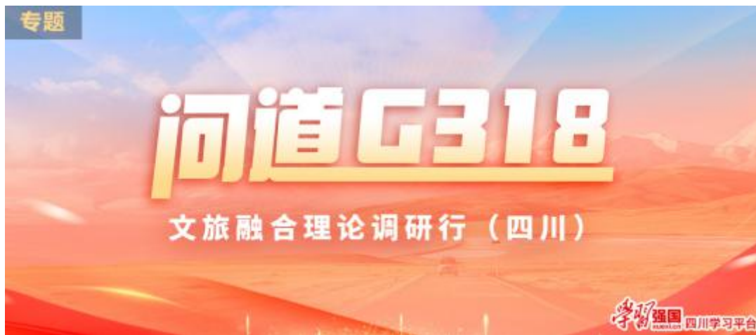
《问道 G318——文旅融合理论调研行（四川）》专题截图

3.启动“问道 G318——文旅融合理论调研行（四川）”活动。汇聚安徽、湖北、重庆、西藏等省（区、市）学习平台代表和甘孜、成都、资阳、遂宁等省内市州学习平台记者编辑，以及理论专家和金牌宣讲员等 50 余人参加。调研团深入雅安飞仙关文旅街区、蜂桶寨乡邓池沟新村等 6 个点位开展沉浸式调研，形成系列调研报告。并对达州、广安、遂宁、南充、资阳、成都、雅安、甘孜等 8 个 G318 沿线点位进行采访，推出系列融媒产品。