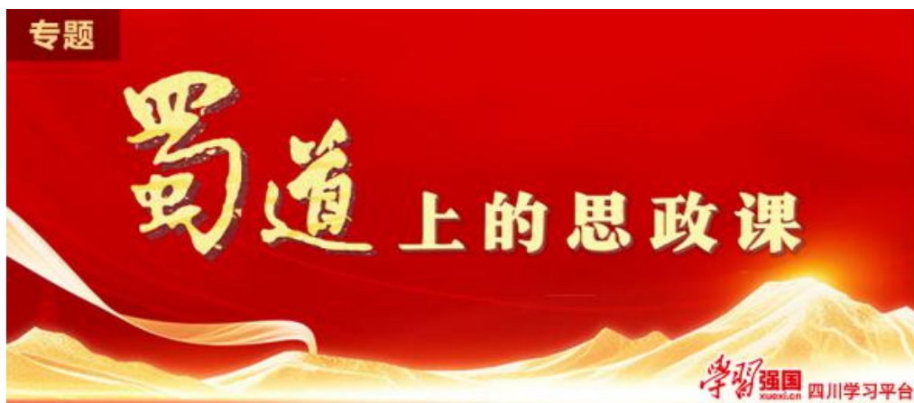
《蜀道上的思政课》专题截图

为贯彻落实习近平总书记关于文化遗产保护传承的重要指示精神和中共四川省委十二届七次全会关于文旅深度融合发展的决策部署，推出《蜀道上的思政课》系列报道，以成都天回镇、广元翠云廊等蜀道标志性场景为实地课堂，采取“现场教学+理论宣讲”相结合的方式，深挖蜀道文化内涵与当代价值，将思政教育和理论宣讲有机融入蜀道保护和传承实践中，探索形成一条“线下思政课”创新实践路径。