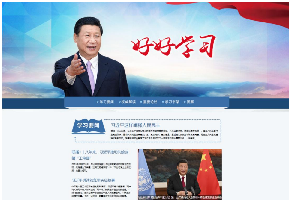
《好好学习》专题截图

1.突出政治引领，深入学习宣传习近平新时代中国特色社会主义思想。 深入开展习近平总书记和习近平新时代中国特色社会主义思想网上宣传，在四川新闻网首页显著位置开辟专区，及时准确报道习近平总书记重要活动、重要讲话，深入阐释解读习近平文化思想，全景、多维、立体展现习近平总书记来川考察后当地发生的巨大变化、呈现的崭新气象，全面反映各地牢记嘱托、感恩奋进取得的显著成就和人民群众更多的获得感、幸福感、安全感。