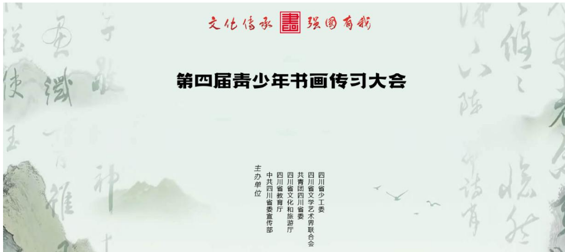
《第四届青少年书画传习大会启动仪式》专题截图

3.启动“问道 G318——文旅融合理论调研行（四川）”活动。汇聚安徽、湖北、重庆、西藏等省（区、市）学习平台代表和甘孜、成都、资阳、遂宁等省内市州学习平台记者编辑，以及理论专家和金牌宣讲员等 50 余人参加。调研团深入雅安飞仙关文旅街区、蜂桶寨乡邓池沟新村等 6 个点位开展沉浸式调研，形成系列调研报告。并对达州、广安、遂宁、南充、资阳、成都、雅安、甘孜等 8 个 G318 沿线点位进行采访，推出系列融媒产品。