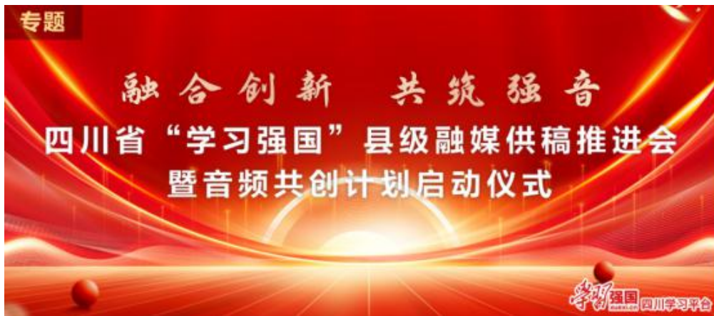
“融合创新 共筑强音”——四川省“学习强国”县级融媒供稿推进会暨音频共创计划启动仪式 专题截图

遴选出充分展现新时代四川县级融媒守正创新、深耕基层的蓬勃活力的 10 件“十佳作品”和 30 件“优秀奖作品”展播名单，并启动四川省“学习强国”音频共创计划。