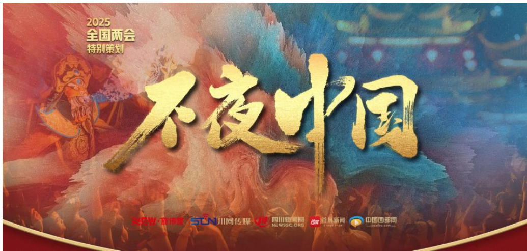
《不夜中国》产品截图

在成渝地区双城经济圈建设 5 周年之际，2025 年开年首月，策划推出“家门口的‘幸福圈’”系列报道，深入成都、广安、泸州等多地采访拍摄，见证成渝地区双城经济圈建设由点及面、由量变到质变的 5 年变化。与“学习强国”重庆学习平台联动推出相应专题，制作长图海报《一图看双圈铁路建设 5 年有哪些大事》和视频《60 秒看“双圈”十大标志性成果》。