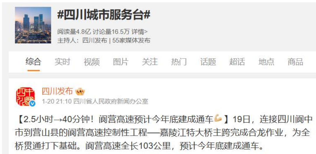
《微博城市服务台》报道截图

1.民生报道切实为民服务。 建立#四川城市服务台#。四川发布发挥四川政务微博矩阵完整、应对突发事件经验丰富的优势，成为“微博城市服务台”共建计划中全国首批启动“城市服务台”的政务新媒体之一。#四川城市服务台#发布政务服务、权威发布、政策解读、民生实事、天气预警、出行提示、科普知识等信息，帮助网友了解四川。目前四川发布创建的微博话题#四川城市服务台#阅读量超4.8亿。