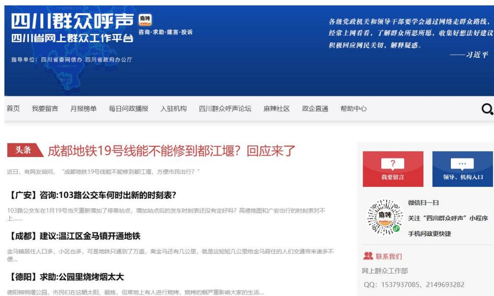
《群众呼声》栏目截图

调查报道推动政策优化：群众呼声“我为群众办实事”栏目发布 196 个典型案例及多篇调查稿件，围绕各类民生热点推出系列报道，推动四川多条高速提高限速标准，有效缓解交通拥堵，取得良好社会效应。