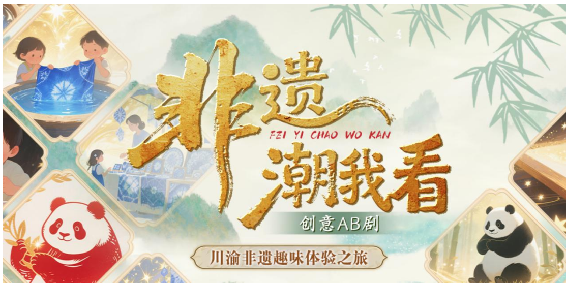
《创意 AB 剧 | 非遗“潮”我看》产品截图

1.以年轻态产品讲好非遗故事，推出《创意 AB 剧 | 非遗“潮”我看》。聚焦绵竹年画、珙县苗族蜡染、自贡扎染、四川剪纸等非遗项目，以极强的体验感、互动感生动讲述非遗故事，展现被赋予新的时代音量的古老技艺，展现在文旅融合中绽放多彩光芒的文化瑰宝。