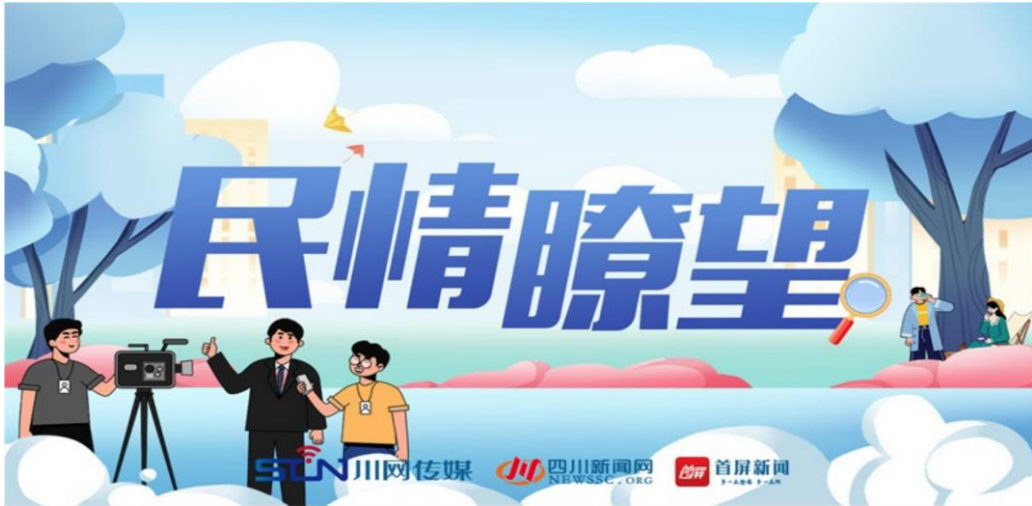
《民情瞭望》专题截图