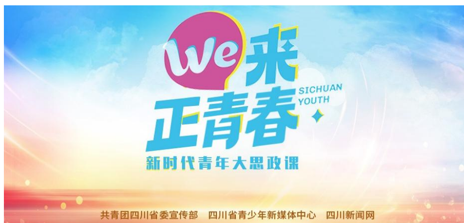
《We 来·正青春》专题截图

2.暖心故事弘扬社会正能量。做好青年思想引领，四川新闻网推出专题《We 来·正青春》，以青年为主角讲述自身故事，将宏大理论融入青年自身奋斗历程，形成系列“We 来·正青春”新时代“大思政课”。尤其值得一提的是，为纪念中国人民抗日战争暨世界反法西斯战争胜利 80 周年，以“抗战主题三部曲”为载体，从四川乡村、民族、学校三大维度切入，通过沉浸式叙事、历史场景还原与青年视角解读，生动诠释抗战精神的时代内涵，实现重大主题宣传的破圈传播与社会价值引领。