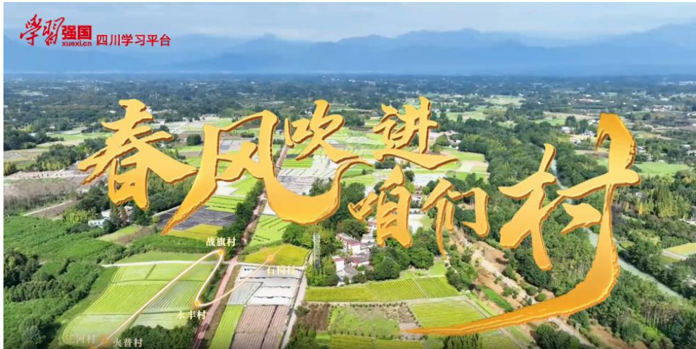
主题报道《春风吹进咱们村》截图

联动凉山、成都、眉山、绵阳等市州学习平台深入村落，聚焦总书记关注的悬崖村、三河村、火普村、战旗村、永丰村、石椅村，推出主题报道《春风吹进咱们村》，曾经贫瘠偏远的它们，如今因春风拂动焕发新颜，科技助力振兴，医疗保障生活，文旅融合让乡村文化多彩。