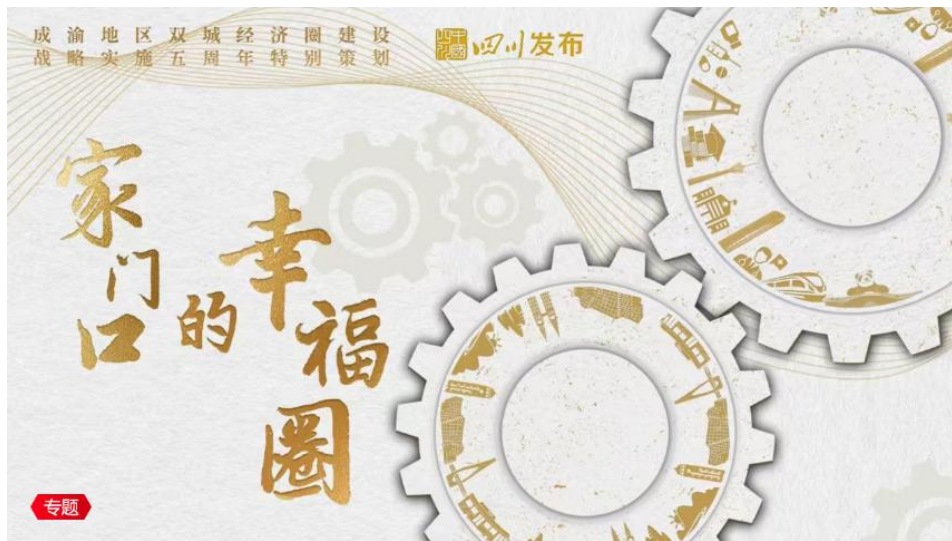
《家门口的‘幸福圈’》专题截图

在成渝地区双城经济圈建设 5 周年之际，2025 年开年首月，策划推出“家门口的‘幸福圈’”系列报道，深入成都、广安、泸州等多地采访拍摄，见证成渝地区双城经济圈建设由点及面、由量变到质变的 5 年变化。与“学习强国”重庆学习平台联动推出相应专题，制作长图海报《一图看双圈铁路建设 5 年有哪些大事》和视频《60 秒看“双圈”十大标志性成果》。