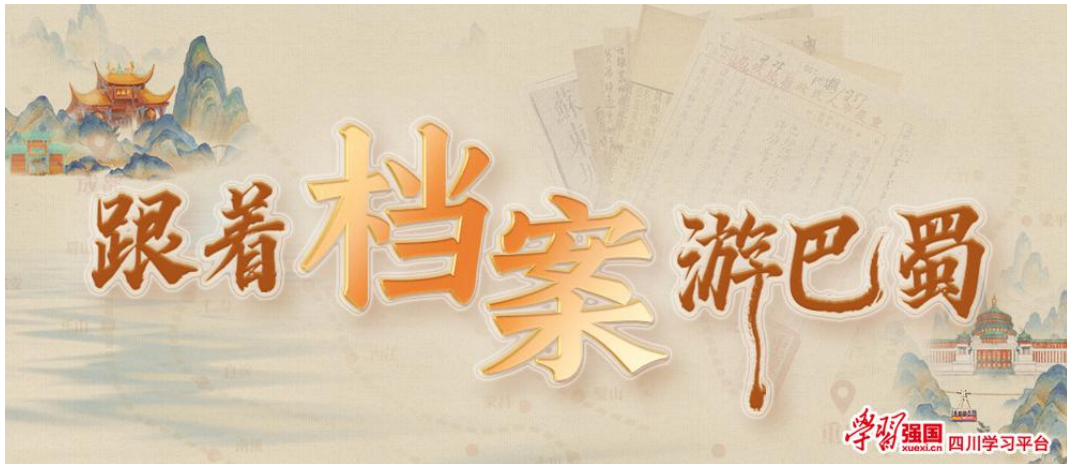
《跟着档案游巴蜀》专题截图