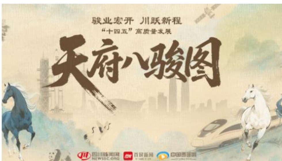
《天府八骏图》产品截图

聚焦“十四五”成就，推出手绘长卷《天府八骏图》，展示了四川综合实力和核心竞争力显著增强，区域城乡发展更加协调，改革开放取得新的突破，绿色低碳转型步伐加快，人民生活品质稳步提高，安全稳定基础更加坚实，绘就了一幅色彩斑斓的四川画卷。