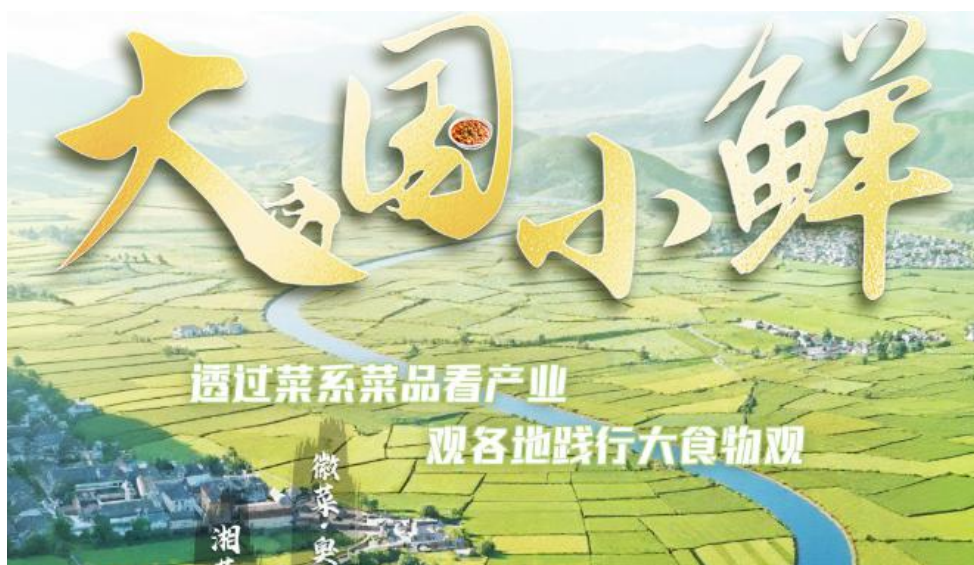
《大国小鲜》产品截图

联动山东、广东、江苏、浙江、福建、湖南、安徽等省级“学习强国”平台推出融媒互动产品《大国小鲜》，以食为媒，用“视频+互动游戏”相结合的方式，透过菜系菜品看产业，观各地践行大食物观，讲述全国各地“中国人的饭碗任何时候都要牢牢端在自己手中，我们的饭碗应该主要装中国粮”的生动实践。