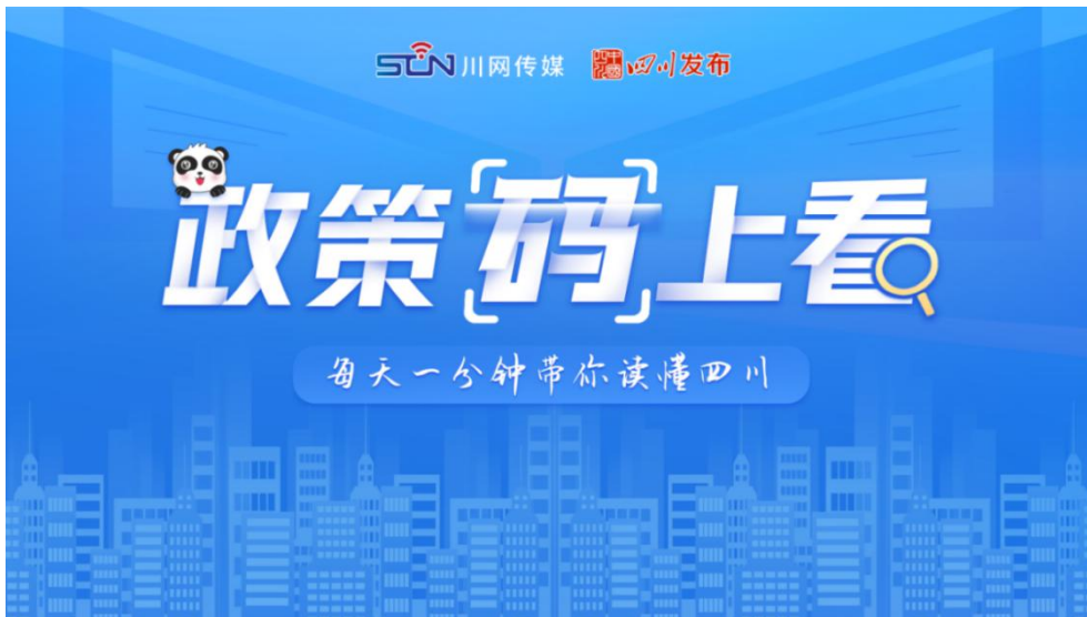
《政策“码”上看》专题截图

四川发布继续推进“画图点今”政策解读原创专栏，推出共 23 期“画图点今”。其中，围绕省政府文件《关于进一步推动经济运行回升向好的若干政策措施》，四川发布客户端通过图文、图解等不同方式多维度做好相关解读工作，帮助网友更准确更直观地了解政策要点。