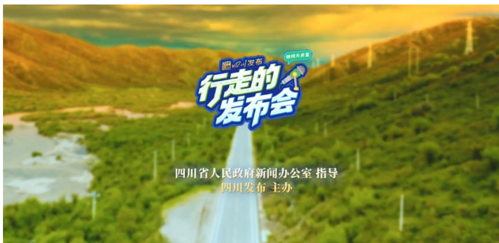
《行走的发布会》产品截图

场景从传统的发布厅延伸至基层一线。首季“锦绣天府篇”内容播出以来，全网累计阅读量已超过 4 亿+、微博话题阅读量达到 1.1 亿、抖音话题阅读量突破 9300 万、每集节目微博播放量均达到 100 万+。得到了新华社、人民日报等央媒，北京、天津、云南等全国近 30 家主流媒体，广元、乐山、阿坝等市县逾 650 个账号，以及天府融媒联合体的全网推送。