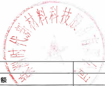
附表 1: 募集资金使用情况对照表