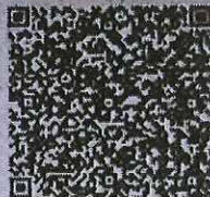
乔琪的年检二维码

本证书经检验合格，继续有效一年。 This certificate is valid for another year after this renewal.