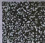
乔琪的年检二维码

本证书经检验合格, 继续有效一年。 This certificate is valid for another year after this renewal.