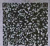
乔琪的年检二维码

本证书经检验合格, 继续有效一年。 This certificate is valid for another year after this renewal.