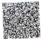
黄玉清的年检二维码.png

本证书经检验合格, 继续有效一年。 This certificate is valid for another year after this renewal.