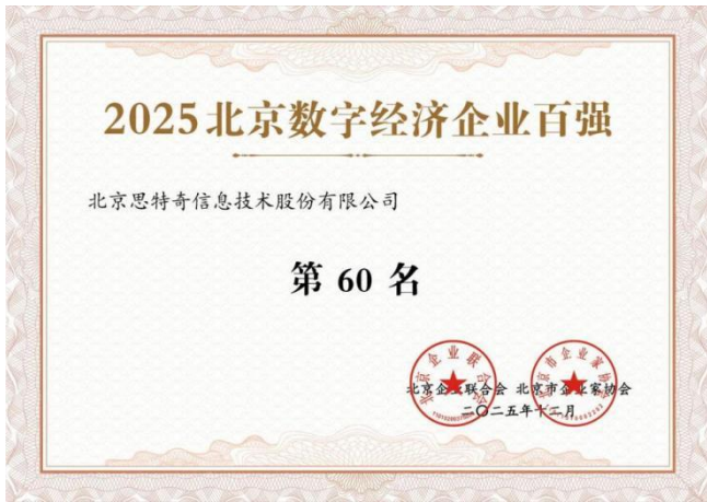
2025 北京数字经济企业百强