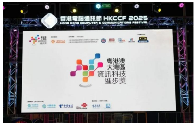
2025 年粵港澳大湾区信息科技进步奖（三项一等奖与一项优秀奖）