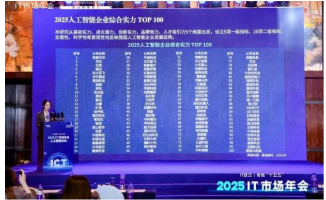
2025 人工智能企业综合实力 TOP100