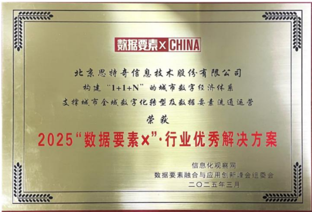
2025“数据要素x”行业样板 100 例