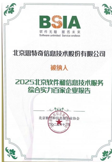
2025 北京软件和信息服务业综合实力百家企 业报告