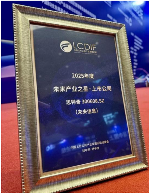
2025 “未来产业之星”上市公司