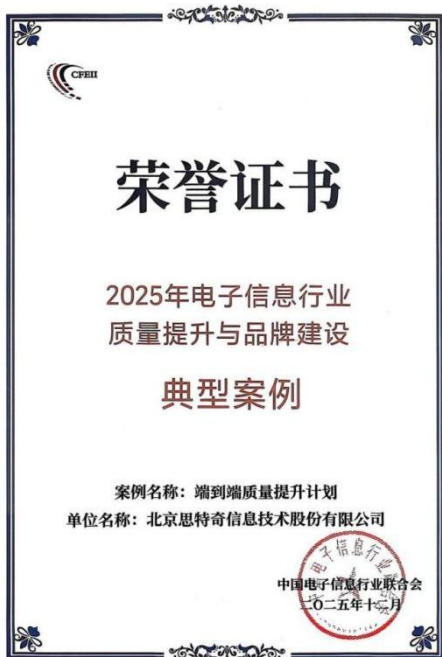
2025 年电子信息行业质量提升与品牌建设典 型案例