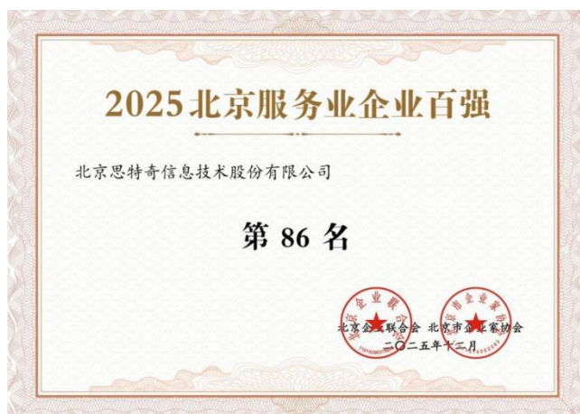
2025 北京服务业企业百强