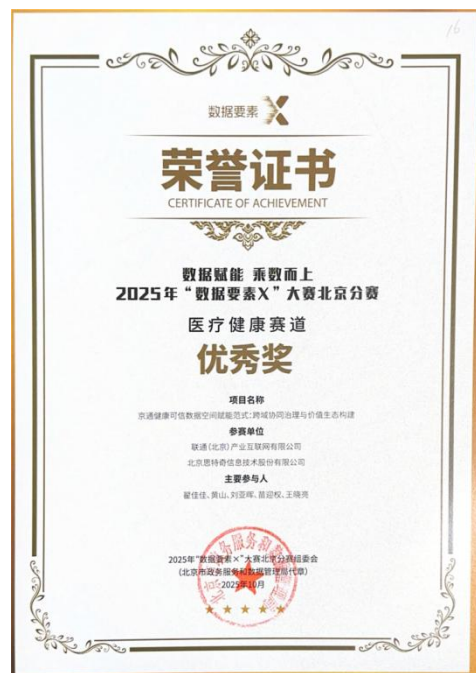
2025 年“数据要素 X”大赛北京分赛医疗健康赛道优秀奖