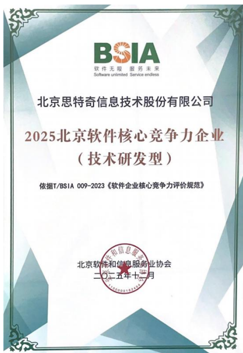
2025 北京软件企业核心竞争力企业（技术研发型）