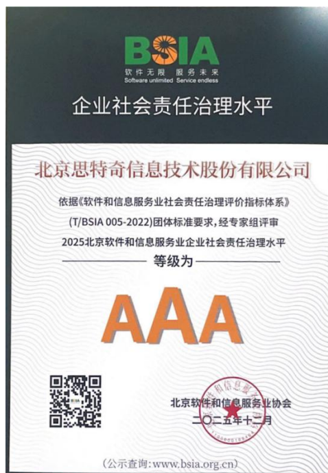
2025 北京软件和信息服务业企业社会责任治理水平 AAA 级