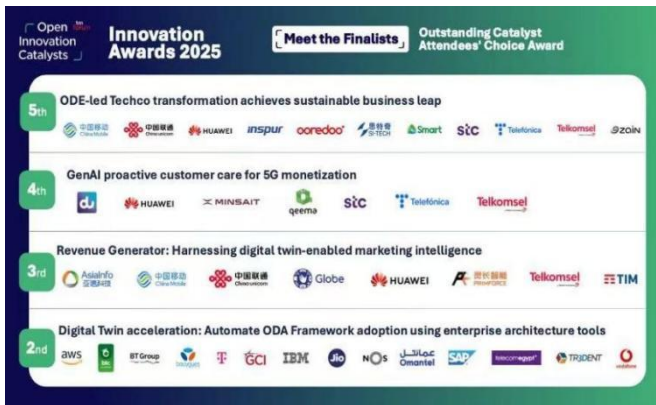
DTW Ignite25 催化剂项目 Open Innovation Catalyst-最受参会嘉宾喜爱短名单奖