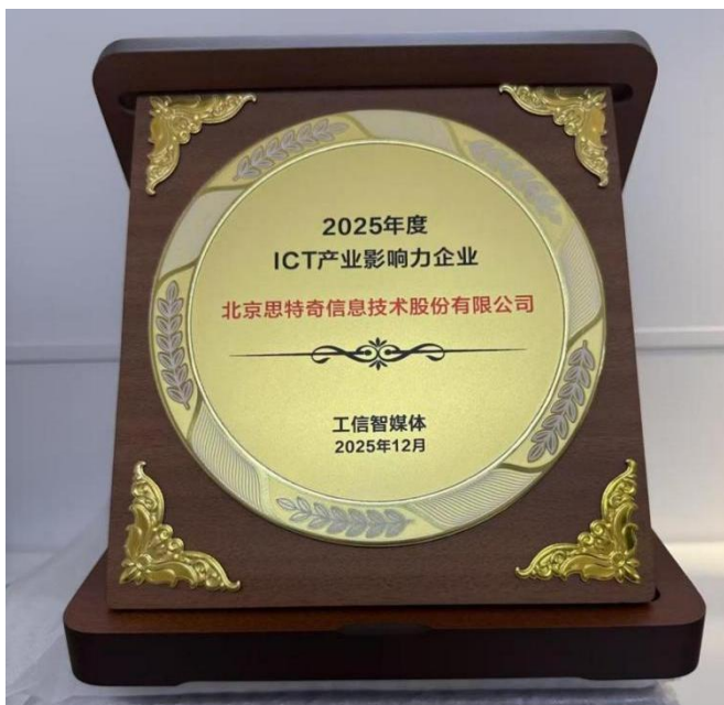
2025 年度 ICT 产业影响力企业