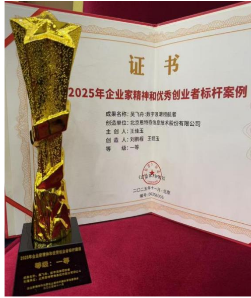
2025 年企业家精神和优秀创业者标杆案例