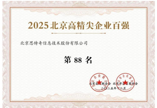
2025 北京高精尖企业百强