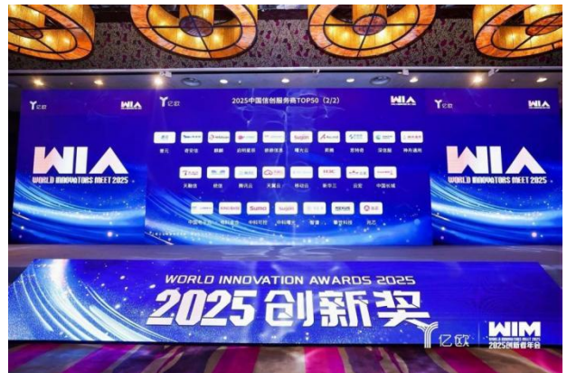
2025 中国信创服务商 TOP50