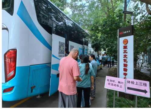
图 3 东方工厂健康体检

2. 依据公司作业场所职业病危害风险建立职业病危害风险分级管控制度。根据作业场所或作业岗位存在的职业病危害因素的固有危害程度、接触水平和作业工人体力劳动强度，进行工作场所职业病危害作业分级，在此基础上综合考虑多种有害因素对风险的影响权重，结合作业岗位职业病危害因素的接触人数、防护水平和健康效应，借助风险评估的经验公式量化发生职业病或职业健康损伤的可能性和严重性，判定风险等级。按照作业岗位职业病危害风险级别实施职业病危害风险控制措施和分级管控。