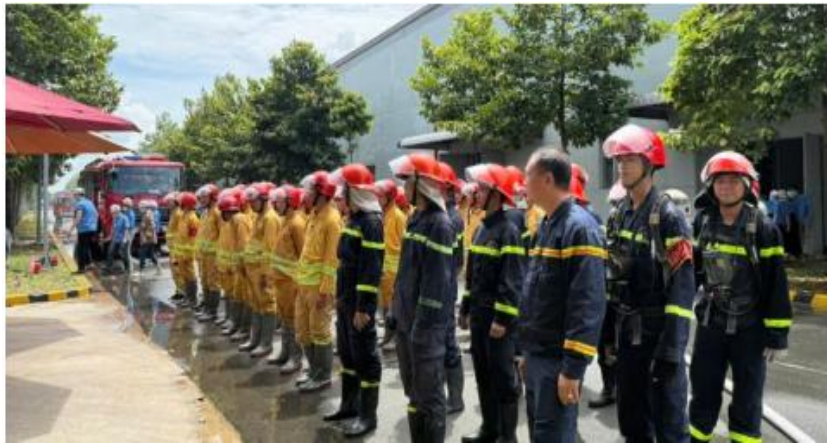
图 2 2025 年越南百隆年度消防演习

3. 在工作场合体现安全文化氛围：充分利用班前班后会有限的时间，把最需要学的，必须掌握的安全知识讲给职工，内容要精，重点突出，让大家易学易懂。通报安全生产情况，学习有关知识。把安全文化实实在在体现在职工的工作岗位上和生活学习的全过程。