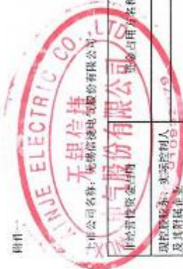
2025年度非经营性资金占用及其他关联资金往来情况汇总表