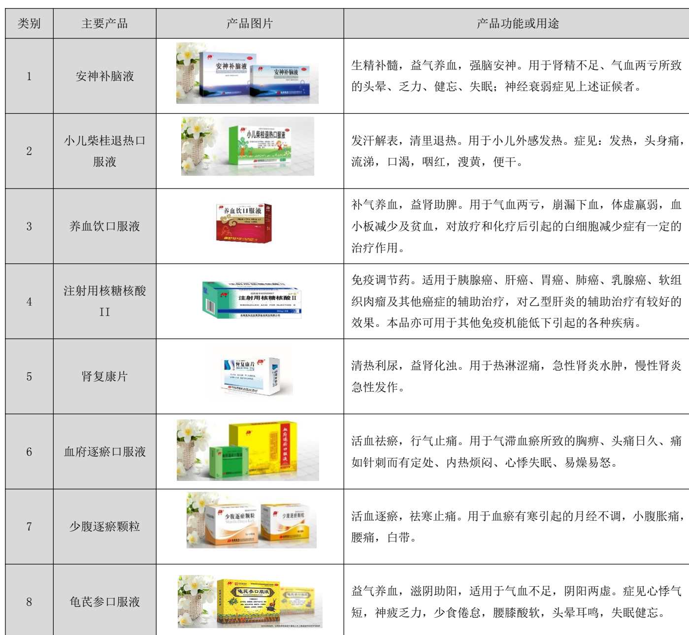
表 2. 公司主要产品目录