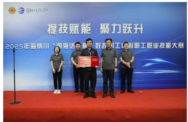
职工职业技能大赛