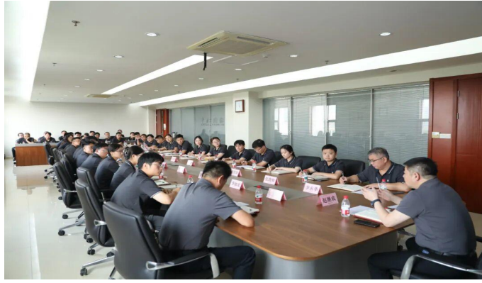
渤海雏鹰项目启动

公司非常注重员工的身体健康，每年定期组织员工进行健康体检；对于涉及职业危害的特殊岗位员工还专门组织开展了职业病危害岗位体检，为员工提供安全、健康、卫生的工作条件和生活环境，保障员工职业健康，预防和减少职业病和其他疾病对员工的危害。此外，公司还为生产作业人员提供符合安全劳动标准的劳动保护设施和个人安全防护用品，最大程度地减少职业危害。