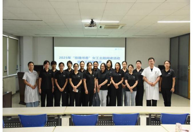
主题阅读暨职工健康讲座