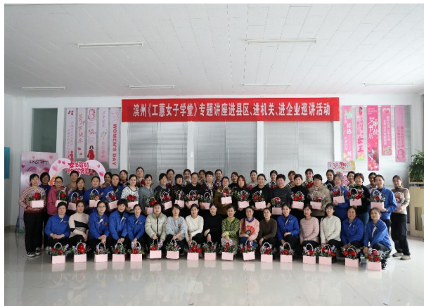
三八妇女节插花活动