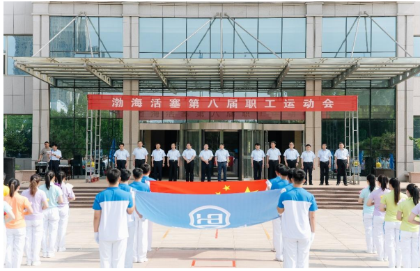
第八届职工运动会