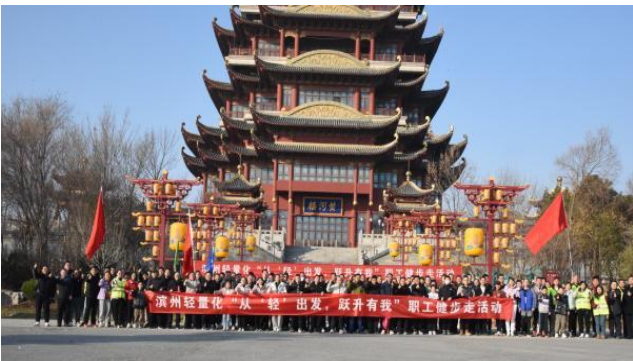
滨州轻量化职工健步走活动