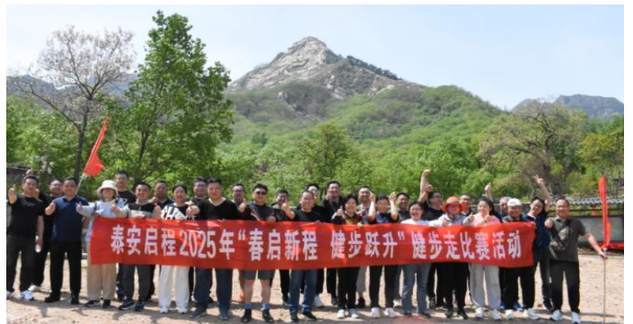
泰安启程跃升健步走活动