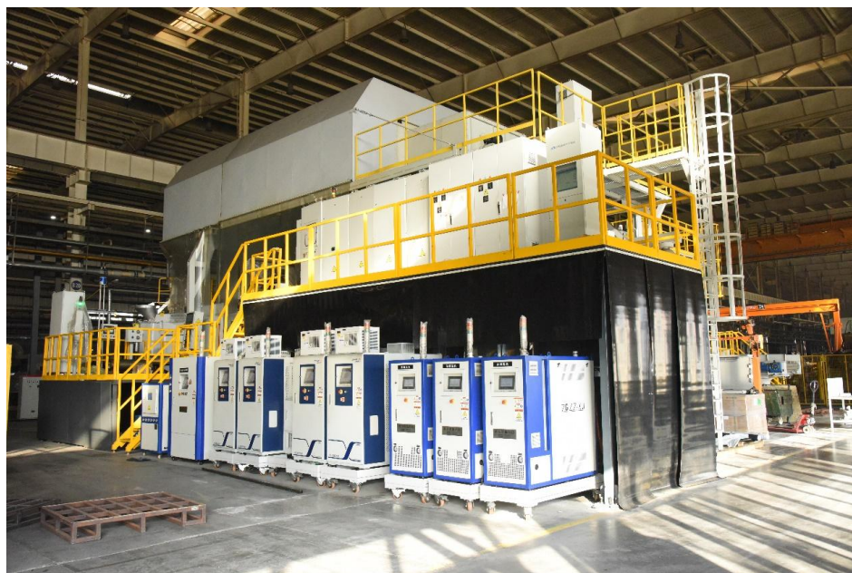
滨州轻量化压铸设备

子公司泰安启程车轮制造有限公司是山东省高新技术企业、省级技术中心，截至 2025 年 12 月份，泰安启程共取得专利 21 项，其中发明专利 3 项，实用新型专利 18 项。