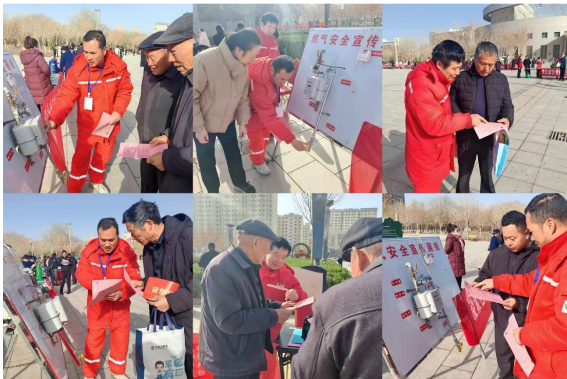
“走进社区用气安全教育宣传活动”