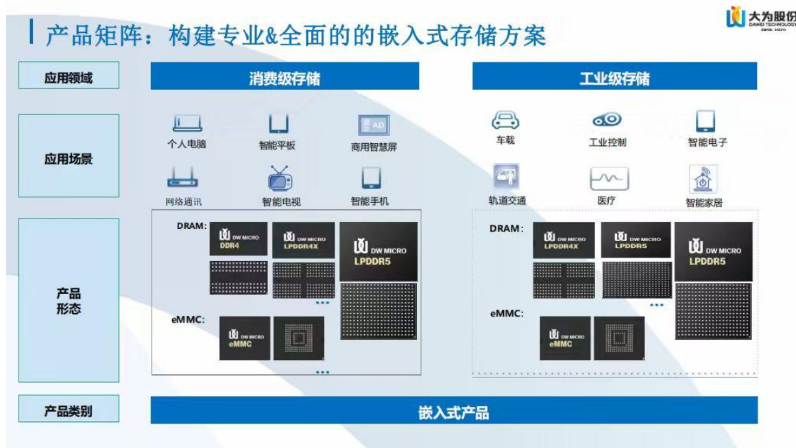
图：大为创芯半导体产品矩阵

2025 年，半导体存储行业迎来量价齐升的市场机遇，公司精准把握行业周期，积极拓展供应商资源以保障供应链韧性，前期战略储备的库存得以高效释放利润。同时，公司紧跟市场需求，坚持以客户为导向，持续优化产品结构，提升数据中心及高性能计算相关领域的收入占比，推动产品毛利率显著提升至 4.43%（同比上升 3.04 个百分点）。在上述举措共同驱动下，半导体存储业务业绩实现跨越式增长：全年营业收入达 10.98 亿元，同比增长 25.20%，首次突破 10 亿元大关，整体盈利能力大幅增强。