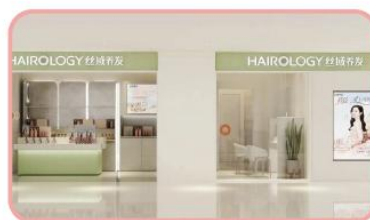
丝域科技养发门店