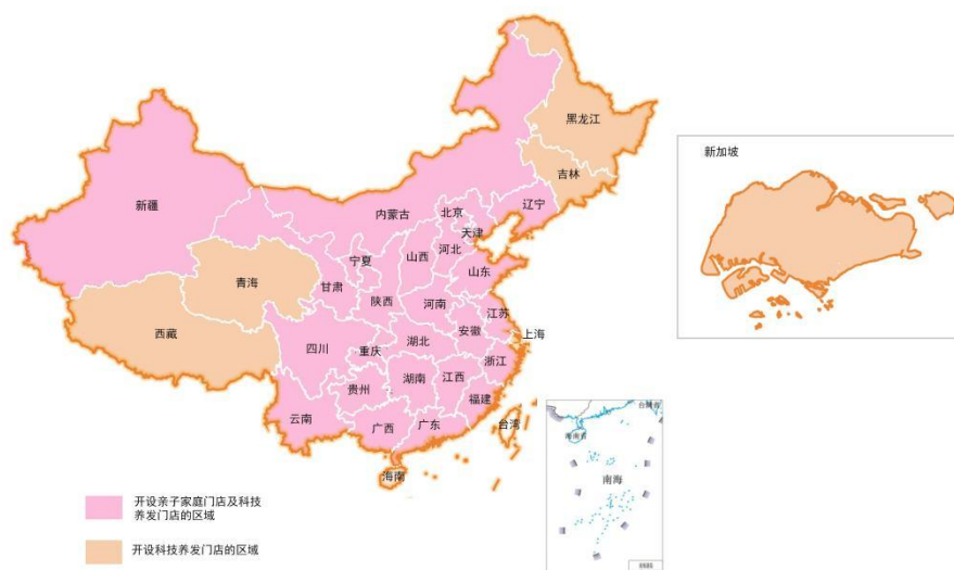
图 公司门店分布图

报告期内，来自加盟店收入（加盟费、品牌使用费、批发收入等）为 54,766.80 万元。