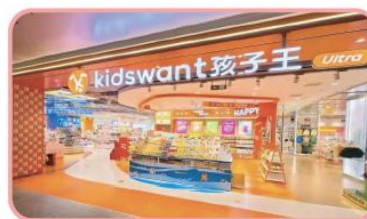
孩子王 Ultra 店