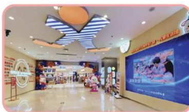
孩子王全龄段儿童生活馆