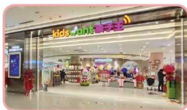
孩子王第十代数字化门店

2025 年 6 月，孩子王 Ultra 店于上海徐汇万科广场正式落地，深度融合潮玩 IP、“谷子经济”与 AI 科技，打造超 600 种前沿育儿场景解决方案，全方位满足精致养娃、悦己生活与亲子成长需求。优选小店聚焦高线城市准妈妈及 0-6 岁婴童群体，以 300 m 2 空间构建 8 大场景，树立轻量化母婴门店标杆，已进驻 15 个高线城市、开设 33 家门店，提供“高品质、高密度、高便捷”的育儿服务。自营小店依托 2025 年 4 月与乐友国际全面整合，统筹近 500 家自营门店，重点强化北方市场份额，充分释放 1+1>2 的协同效应，全方位满足亲子家庭多元化消费需求。