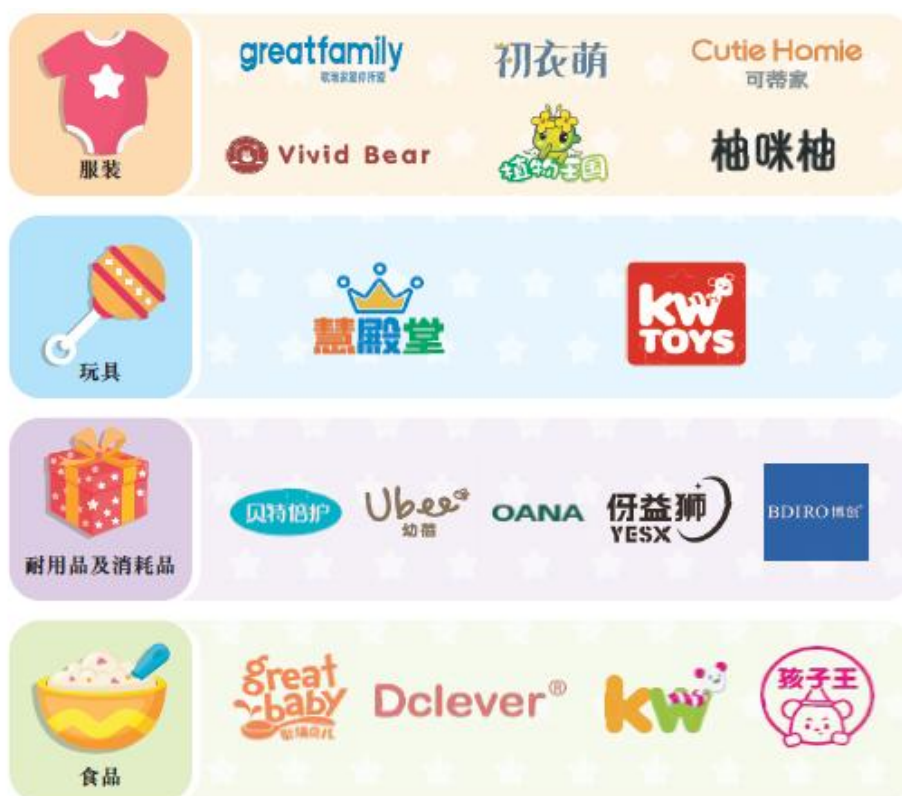
公司部分自有品牌

同时，公司与头部品牌深度合作，推出联合独家定制产品，并在奶粉、零辅食、用品等多个品类布局第三方独家定制商品。2025 年，公司的自有品牌和第三方独家定制商品的规模正在快速增长，2025 年收入同比提升了 79.33%。