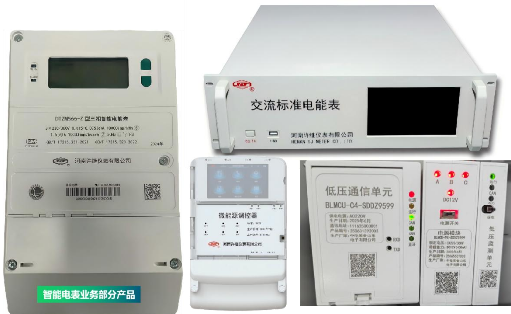
智能电表业务部分产品

智能终端为中心打造边缘计算处理平台，快速构建基于营配融合的低压智能用电解决方案，应用于营配融合、精益化台区管理、台区反窃电、有序用电、共享用电等场景。公司智能电表业务主要产品包括智能电表、智能用电终端、用电采集系统、微型断路器、物联网开关等。