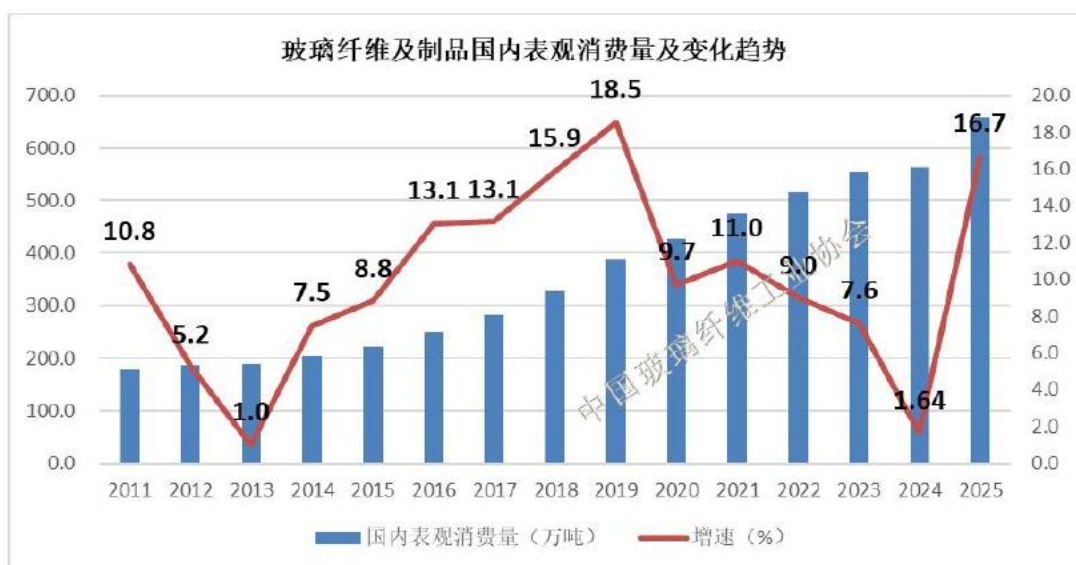
图 3 2011 年以来我国玻璃纤维及制品国内表观消费量及变化趋势

2025 年，我国国内玻璃纤维及制品表观消费总量达到 658.5 万吨，同比增长 16.7%，其中电子及增强用玻纤毡布制品明显增长，工业用玻纤毡布制品则出现小幅收缩。