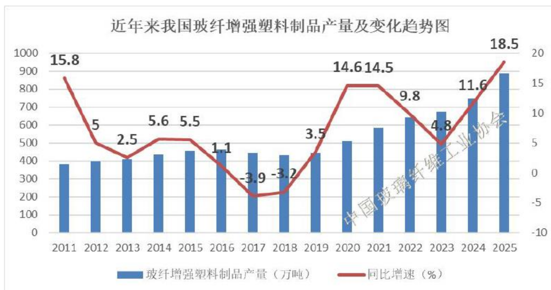
图 4 2011 年以来我国玻纤增强塑料制品产量及变化趋势图

经协会统计，2025 年我国玻璃纤维普通热固直接纱、合股纱、高模量纱和热塑纱总产量分别达到 251.3 万吨、110.1 万吨、143.6 万吨和 184.3 万吨，国内热固、热塑增强用玻璃纤维纱表观消费分别约为 379.7 万吨和 156.5 万吨，同比增长 22.6%和 13.4%。据此测算，2025 年我国玻纤增强塑料制品总产量约为 889 万吨，同比增长 18.5%。其中：玻纤增强热固类塑料制品总产量约为 451 万吨，同比增长 24.1%；玻纤增强热塑类塑料制品总产量约为 438 万吨，同比增长 13.5%。2025 年全国风电新增装机容量 120GW，同比增长 51%，全国光伏新增装机 317GW，同比增长 14%。此外 2025 年全国汽车产量为 3478 万辆，同比增长 9.8%，其中新能源汽车为 1652 万辆，同比增长 25.1%。在风电、汽车等主要市场需求稳步增长的带动下，各类玻纤增强塑料制品产量实现较快增长。同时，玻纤增强塑料制品在光伏、储能、低空经济及智慧物流、海洋开发、建筑门窗等领域稳步扩大市场规模，为行业后续发展不断提供新的成长空间。