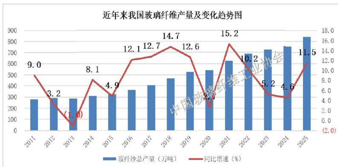
图 1 2011 年以来我国玻璃纤维纱产量及变化趋势图

尽管外贸出口平淡,国内房地产细分市场的需求持续低迷,但玻璃纤维行业作为战略性新材料产业重要组成部分,其下游应用领域广泛且大部分规模化市场具备长期成长性。2024 年底以来随着国内电子、风电及新能源汽车等玻纤规模化应用市场陆续回暖,光伏新能源、安全防护等重点培育新市场稳步增长,玻璃纤维行业稳增长势头明显好转。尤其自 2025 年三季度以来,多个细分赛道出现量价齐升的局面。