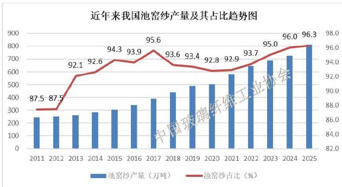
图 2 2011 年以来我国玻璃纤维池窑纱产量及其占比趋势图