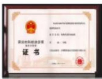
深圳市科技进步奖

2009 年，奥特迅将积累多年的高端工业电源技术下沉进入民用及市政电源的应用与研究，正式进入新能源板块中的电动汽车充电领域，是国内最早进入电动汽车充电领域的厂商之一，奥特迅开发的电动汽车交流充电桩、电动汽车非车载充电机、电动汽车智能充放电机及电动汽车柔性充电堆已广泛应用于全国各类电动汽车充电站，总装机功率超过 300MW（兆瓦）。全国首个面向社会运营的公共充电站—大运中心充电站、全国首个加油充电综合服务站—中石化深圳上步加油充电站、全国首个加油加气充电综合服务站—中石油成都乐园加油充电站、全国功能最全的光储充智能微网系统—深圳国际低碳城智能微网系统、全国首个泊车式充电站示范项目—深圳大运会新能源车充电网络、全国首个基于充电堆技术的充电站—奥特迅电力大厦充电站等，均有奥特迅的产品在运行。公司是电动汽车充电国家标准及行业标准的制定者，曾担任电动汽车充电基础设施促进联盟的电动汽车充电安全委员会副主任委员。目前是深圳最大的公共充电运营商，也是全国唯一拥有成熟的兆瓦级充电堆运行经验的设备供应商。用实干创造纪录，以品质赢得信赖。奥特迅秉持技术匠心与品质坚守，为全球新能源汽车发展提供更安全、更稳定、值得长期托付的充电解决方案。