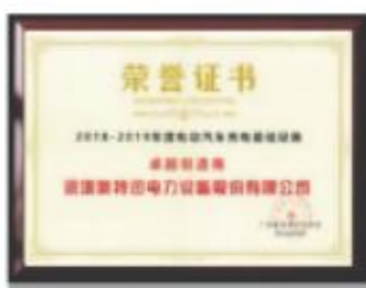
电动汽车充电基础设施卓越制造商