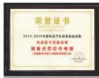
先进技术贡献成果：矩阵式柔性充电堆

公司在业界首创电动汽车柔性充电堆，引领充电行业技术发展方向，已在全国投资、建设及运营超过 150 座集约式柔性公共充电站，总装机功率超过 300 兆瓦，多个站点均采用柔性充电堆技术，按加油站式布局设计，已安全运行长达 10 年。按每天满功率运行 10 小时测算，全网服务能力可达 30 万辆社会车辆，平均一辆社会车辆仅需 1kVA 电力资源。