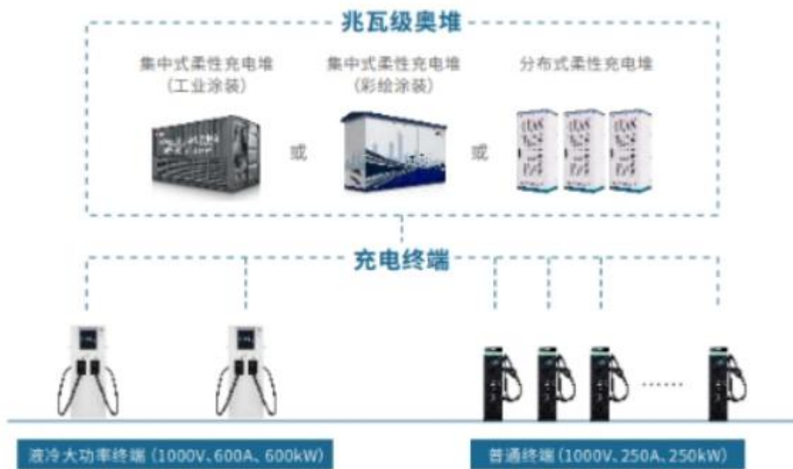
注：图为兆瓦级奥堆