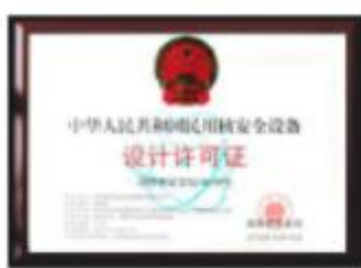
国家核安全设备设计许可证