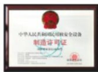
国家核安全设备制造许可证