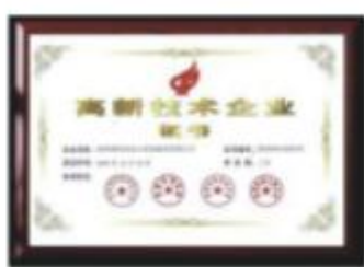
国家高新技术企业证书