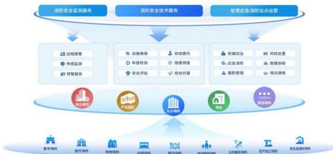
应急消防运营服务

2025 年公司通过并购浙江中辰城市应急服务管理有限公司 51% 股权，成功将业务链条延伸至应急消防领域，形成了安防消防一体化业务布局，丰富了运营服务业务生态，显著增强了公司运营服务业务的综合实力与整体竞争力。