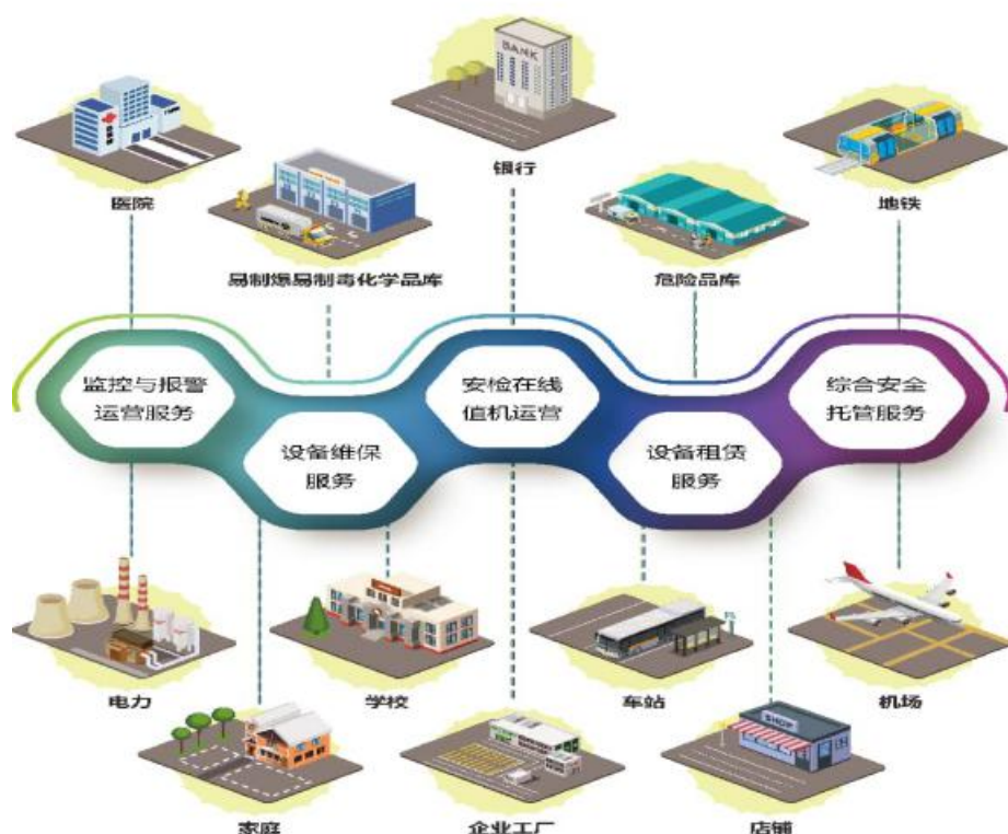
监控报警运营服务