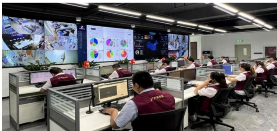
北京总部运营服务中心

公司安防运营服务主要包括：监控报警运营服务、安检运营服务、远程集中判图服务、智慧停车管理服务等四种安防运营服务。