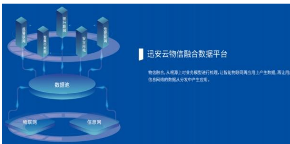
北京迅安云物信融合数据平台

公司深耕安防运营多年，基于云计算、大数据、物联网、人工智能等技术，建立了迅安云物信融合数据平台，可为客户提供 7×24 小时“线上+线下”远程值守监控服务，涵盖信息接收与处置、数据分析与应用、风险管理与控制、设备运行状态监测与巡检维护、系统全生命周期管理等，实现“报警有响应，处置有预案，事件可追踪，运行有保障”的专业化联网运营。