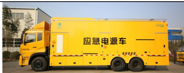
混合 UPS 电源车