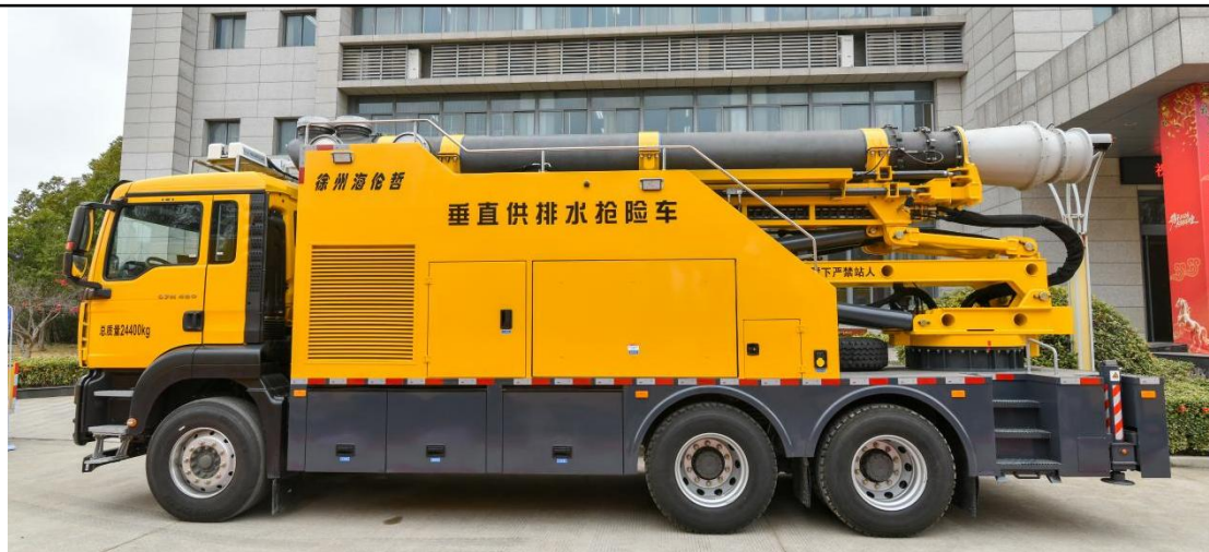
垂直供排水抢险车

公司车辆采用专用汽车底盘上加装特制静音防水车厢，车内配有发电机组等动力装置、大流量水泵、水泵控制器、水带及存储机构、液压泵站、移动泵车、油管绞盘、水泵工作臂架等。子母式排水车移动泵车可以驶离母车深入水下进行排水作业，特别适用于城市内涝区，如城市街道、隧道、电缆沟道、涵洞、地下室等低洼区域；还适用于江河湖泊、水库及淹没地区抗洪抢险；也可以用于农业抗旱应急调水灌溉，作为泵站的补充进行临水调水、应急抽排水等领域。