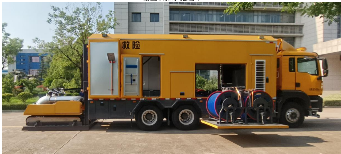
子母式排水抢险车