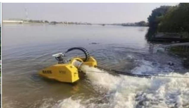
参加广州排水抢险工作