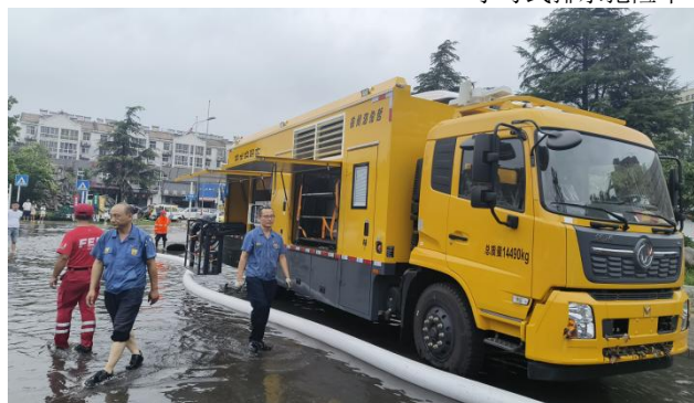
参加徐州经开区排水抢险工作