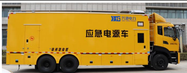
锂电 UPS 电源车

本车型为自主研发的高静音型电源车；主要适用于电力、通信、市政等应急供电保障作业工况；本车是为了满足重要场所重大政治活动高规格保电要求，保障重要负荷的高可靠性、高安全性不间断供电的移动 UPS 电源系统。系统是由以下部分组成：发电机组（选配）、UPS 电源（含 ATS 交流屏及电池开关柜、蓄电池、冷却系统等）、车辆底盘、厢体及监控系统等。