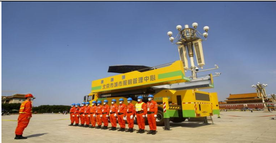
第五代华灯检修车

高空作业机械（专用车辆）定制产品包括华灯检修车、桥式架线车、线杆综合作业车等。公司自主研发的第五代天安门华灯检修车平台可载重 2 吨，是普通高空作业车的 10 倍，平台展开后可满足 20 人同时作业，配置智能灯球自动清洗技术、智能监控指挥系统，被誉为“中华第一车”。线杆综合作业车集挖掘、钻孔、运杆、立杆、夯实于一体，一机即可完成农配网线杆立杆作业，全程机械化，替代传统人工立杆方式，大大提升作业效率和安全性。