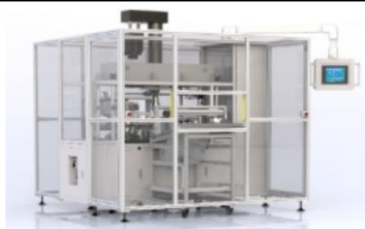
全自动换型校直机