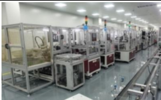
汽车电子水泵定子线