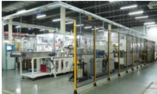
汽车冷却风扇电机自动线