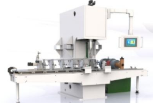
圆钢全自动校直机