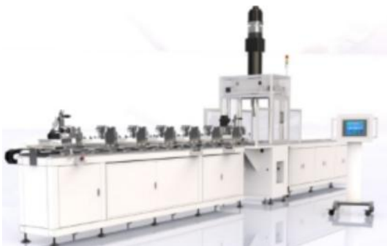
大型轴类自动校直机