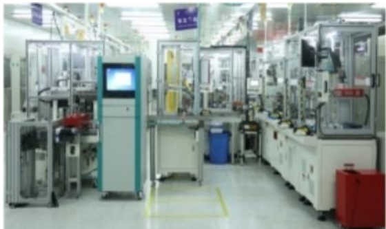
汽车空调鼓风机自动线