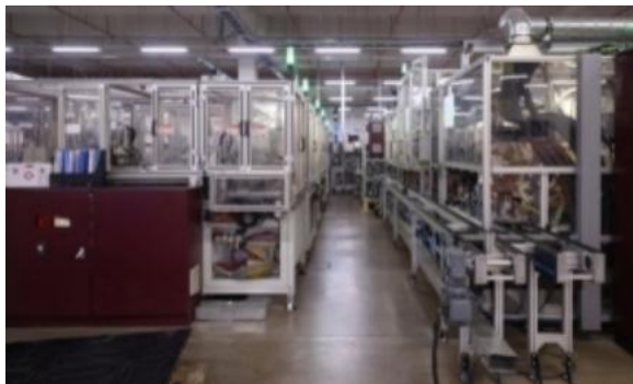
汽车转向助力电机 EPS 定子线