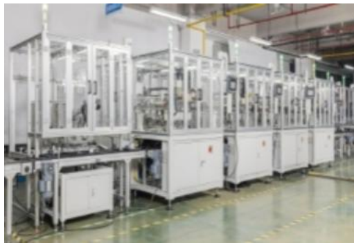
旋转变压器自动线