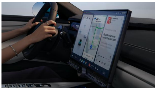
图：新能源汽车镁合金中控屏示意图

公司在镁合金材料应用方面具有多年的制造经验和技術优势，通过半固态射出成型技术，在新能源汽车的轻量化发展趋势中，通过车载屏幕快速切入到新能源汽车的零部件供应链中，可为新能源汽车中控系统、转向系统、电控系统等方面提供应用支持。