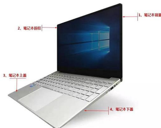
图：笔记本外壳示意图

公司为主流消费电子产品厂商提供精密结构件模组产品，其中以笔记本电脑结构件模组为主。笔记本电脑结构件模组包括四大件：背盖、前框、上盖、下盖以及金属支架，上述结构件模组在装配笔记本电脑过程中需容纳显示面板、各类电子元器件、转轴等部件，其结构性能对制造精密度提出了较高的要求。同时由于其还具有外观装饰功能，故该产品对生产企业的设计能力亦有较高的要求。